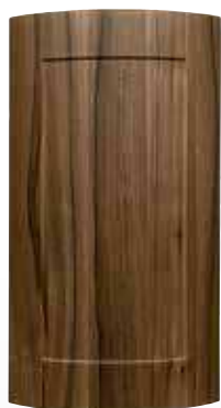
Front pełny gięty