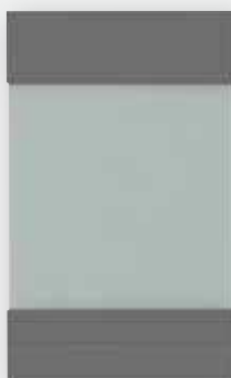
Witryna V2 przefrezowana