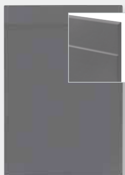
Front pełny przefrezowany