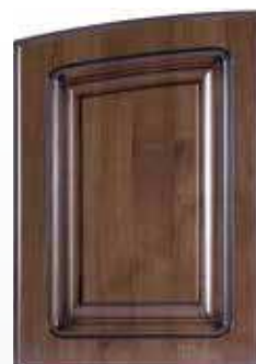
Front pełny łuk