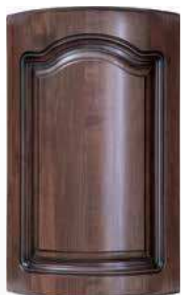
Front pełny gięty