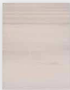
Front pełny AP_G