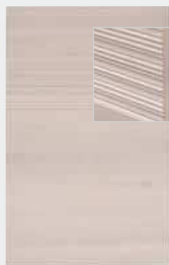
Front pełny AP