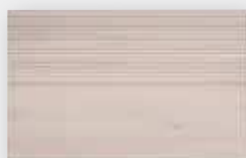
Szuflada PVC + ryfel