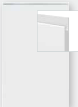
Front pełny/ Szufłada