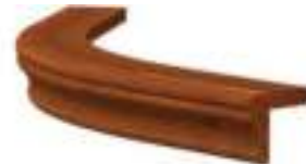
TYP D | LPGL-R240-D | L - 600 | H - 47