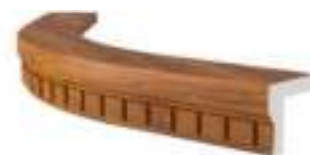
TYP P | LPGL-R240-P | L - 600 | H - 47