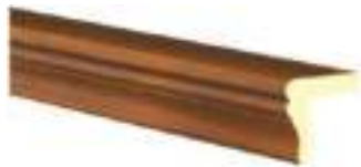
TYP C | LPL-C | L - 1200, 1500, 1800, 2100, 2400, 2700 | H - 47