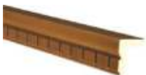
TYP O | LPL-O | L - 1200, 1500, 1800, 2100, 2400, 2700 | H - 47